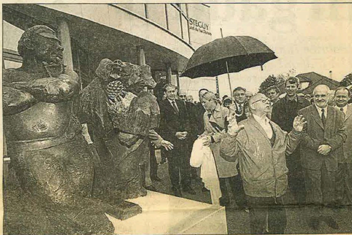
En 2001, lors de l'inauguration du centre Ipoustéguy.